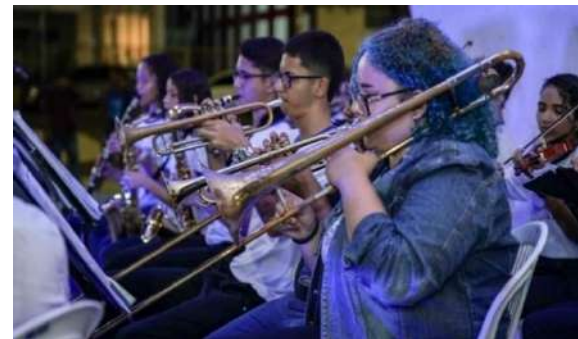
Local: Concha Acústica – Natal Luz Data: 06/01/2023