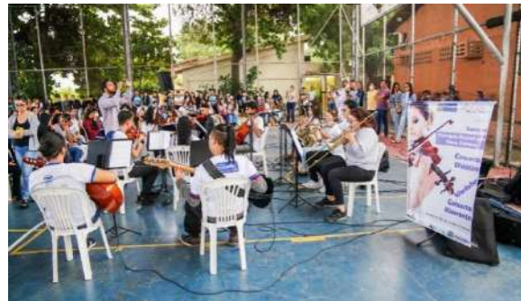
Local: EREM Clementino Coelho Data: 29/05/2023